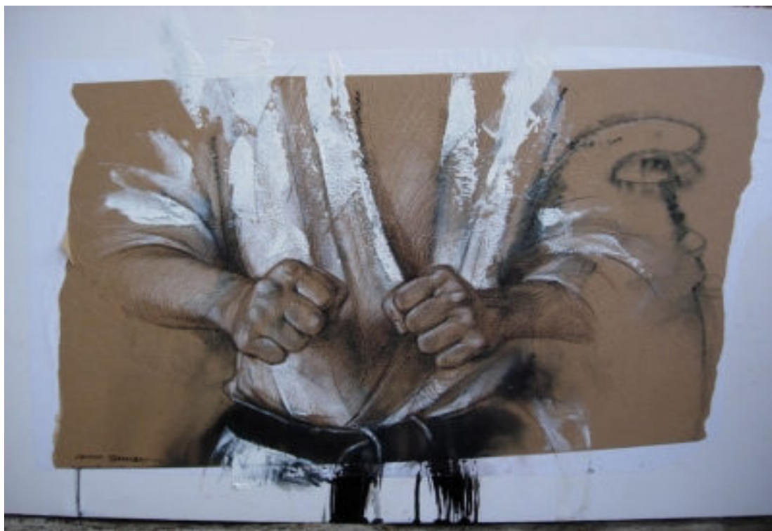
Pintura de Feodor Tamarsky