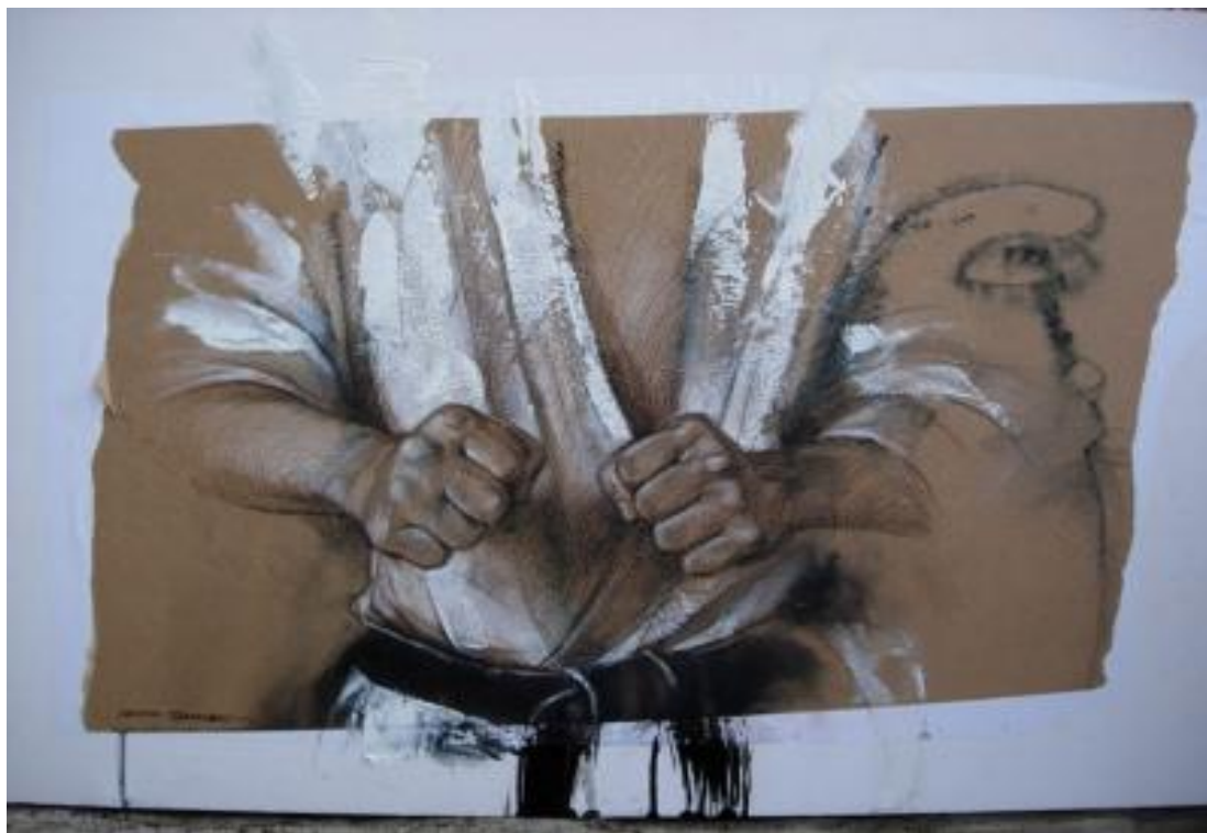
Pintura de Feodor Tamarsky