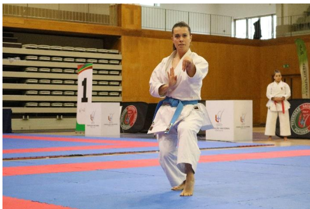
Kata Sénior Feminino