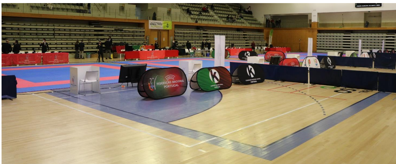
Pavilhão Municipal de Santo Tirso

Os Campeonatos Nacionais Sénior e ParaKarate encontram-se estabelecidos no calendário federativo e realizaram-se no dia 20 de março de 2022 , no Pavilhão Desportivo Municipal de Santo Tirso , sito na Rua do Picoto, 4780-521 Santo Tirso .