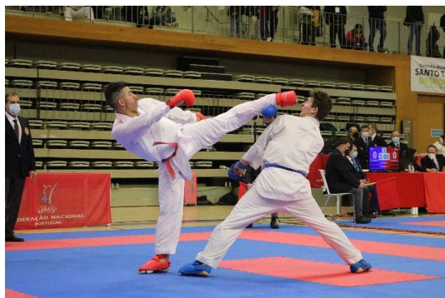
Kumite Sénior Masculino +84kg

Este evento desenrolou-se em quatro áreas, durante aproximadamente nove horas de competição, sem atrasos relativamente ao estabelecido.